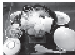
これこれ、これを待っていました