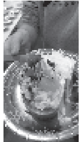
自分好みのトッピング