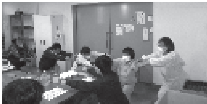
筋肉体操で免疫力もアップだ!