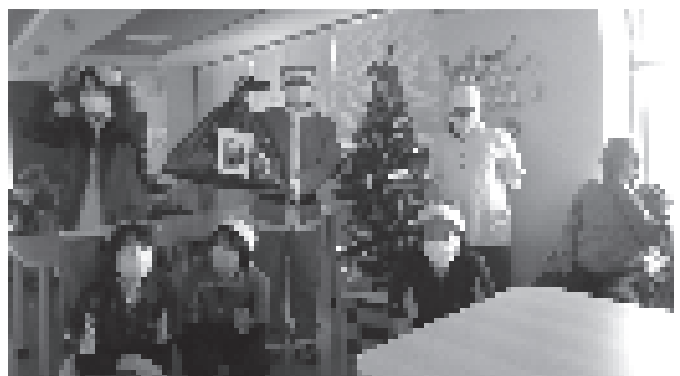
サンタ&トナカイ軍団です