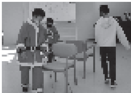
イス取りゲーム、勝つのは誰だ?