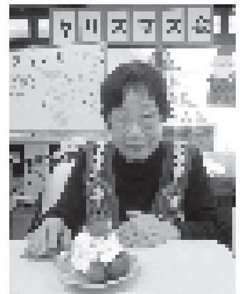
イチゴとクリームたっぷりのミニクリスマスケーキだ