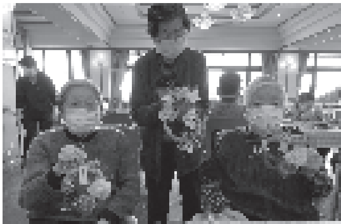
しめ縄の完成で一す!