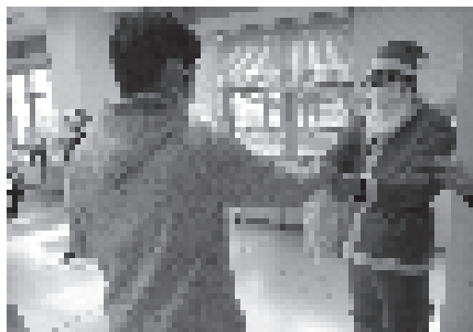
サンタクロースからもらったものは?