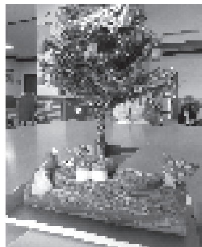
ケーキを食べましょう