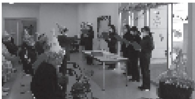
美しく賑やかなハーモニーが響き渡りました