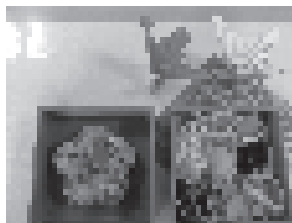
お正月の雰囲気が出ていますね

マイルドハート西荻は住宅街にある施設。近くにスーパーが何軒かあり、新聞にはチラシがたくさん入っています。新聞よりチラシを楽しみにしている方のほうが多いほどです。とりわけ年末のチラシは美味しそうなお写真がいっぱい。カニやマグロ満載のチラシに盛り上がります。「マグロ、豪華ねえ」「カニ食べたいですか？」など利用者様に聞くと「うーん、餃子がいいね」と利用者様。「え？ まだまだ美味しそうなお写真いっぱいですよ」「いやー、やっぱり餃子だね、5