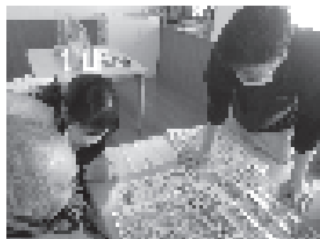
新聞のチラシで盛り上がってしまいました