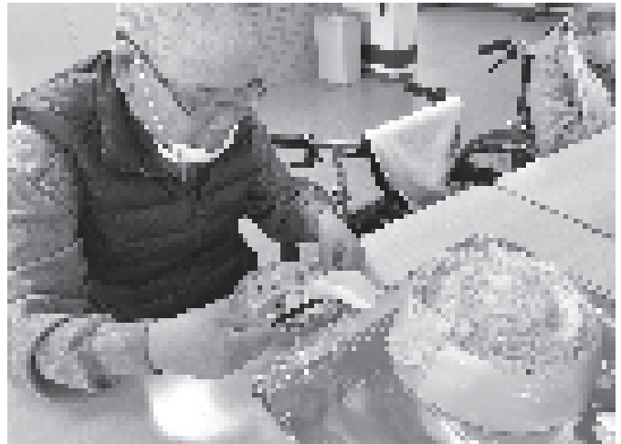
いっぱい食べられそう