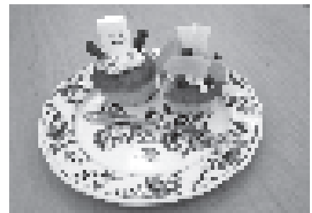
可愛いカップケーキですね