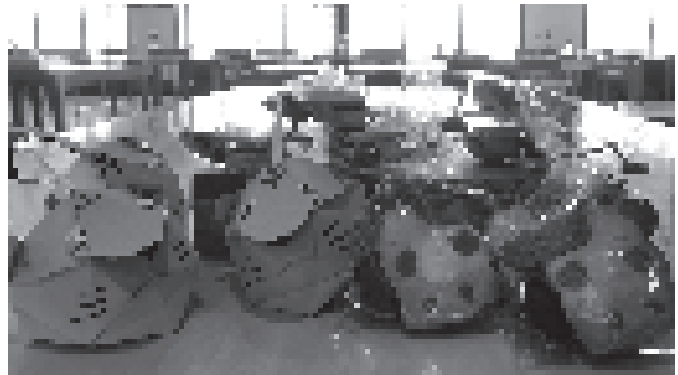
丑のクッキーと寅の折り紙です