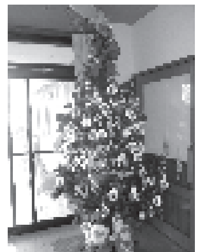
世界に一つだけのクリスマスツリーの完成です