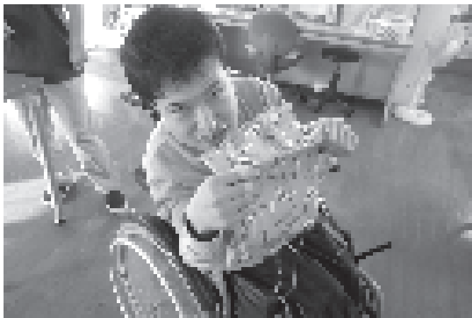
こんなのが当たりましたよ