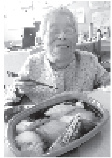
見ただけで旨みが口に広がります

出前が到着し、豪華なお寿司を見ると、「たくさんあって、どれから食べよう?まずはマグロかな」と喜んでいました。一口食べると、「久しぶりに食べたなあ、美味しいねえ」と、とびっきりの笑顔にシャッターチャンスを見逃すまいとカメラマンも力が入ります。「ゆっくり食べてくださいね」と職員の声が飛び交うなか、あっという間に完食していました。職員も入居者様も、今年の締めくくりとして笑顔溢れる素敵な時間を過ごすことができました。