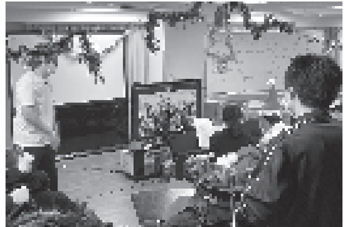
あ、みんな元気そう! コロナに負けないでねー!