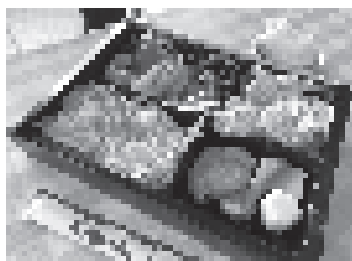
最大のストレス発散は美味しいものを食べること?

コロナ禍のなか、制限された環境ですが、職員全員でアイデアを出し合い活動してきました。それでも、入居者の皆様にはストレスの溜まる日々が多かったことは否めません。