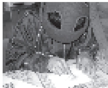
優しく優しく、色を伸ばします